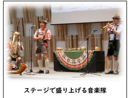
ステージで盛り上げる音楽隊

又、昨年から始めた「家老のミニワインセミナー」にも沢山の方が参加され、持ち帰ったばかりのドイツの土産話に花が咲いていました。(納谷)