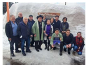
ドイツトリーア市民訪問団受入