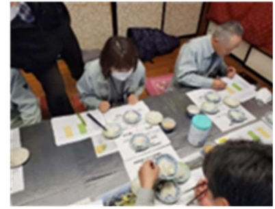
毎年恒例になった JA、行政関係者、米農家を集めての米の試食会