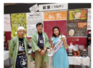
長岡酒の陣 雪の女王と!