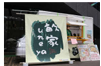
アオーレでの販売

令和4年3月より出店日を毎週木曜に決めた事で仕事の効率化が図られ計画が組みやすくなった。主催者のアオーレ長岡市民協働課には競合店との調整を要望していたが実現せず、競合店が有る日には売り上げが少なかった。又、冬季は売り上げが伸びず、仕込み量を調整する事で対応した。販売人員は職員と障がい者とのペアで行えるようになったので、障がい者の「しごと化」は進んだ。次年度以降は障がい者による仕込みや段取りまで進めたい。その他、原材料、包材等の値上げもあり、令和4年5月より1食600円に値上げした他、正規品にならなかった梅干しをつぶれ梅として販売し、2月末までに141個売り上げた。米の予約販売や餅の販売も行った。