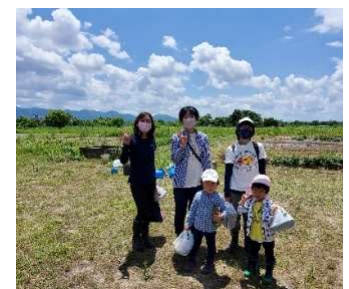
フードバンクながおからの参加者