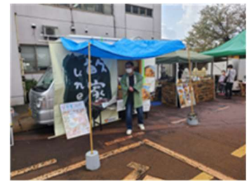
見附ふぁみりあ出店

最大の販売数:7月521食。出店回数11回、販売数2,234食、一回平均203.9食