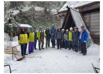
北荷頃 巢守神社排雪作業

・2月には3年振りに来岡したドイツのトリーア市の市民訪問団の受け入れを実施 巨大かまくらの中でのお茶のお点前に参加者全員大感激した。