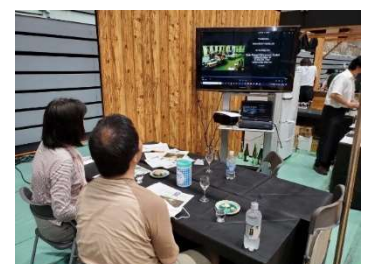
ドイツフェストでのプチワイン試飲会

上記同様3年ぶりの開催だった。例年ナカドマで行われていたが、今年度からはアリーナで入場制限を行う形で開催された。1回2時間600人で制限し、完全入れ替えて開催された。例年1つのブースでどぶろくとおつまみを販売していたが、今