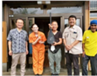
フジテレビ めざまし8