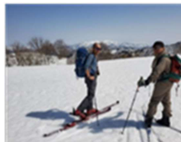
春先の登山スキー