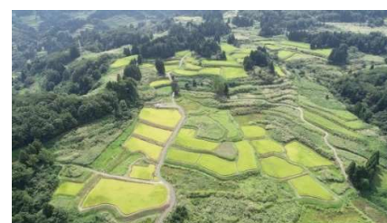
一之貝大沢入地区の棚田 ※放棄地が目立つ