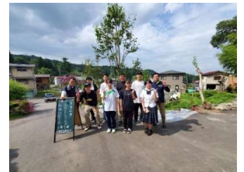
社協 高校生ボランティア