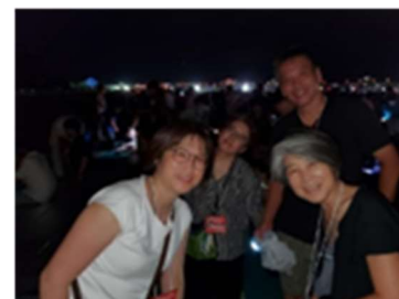
長岡まつり花火大会

売上は増えたが、費用のほとんどが家賃の固定費であるため、1908HAUSの運用を始めないと厳しい。