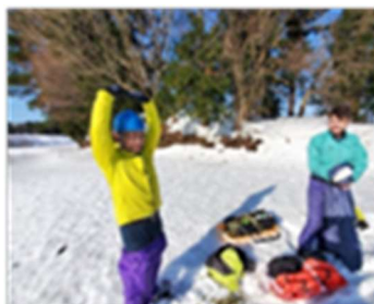
冬のトレッキング