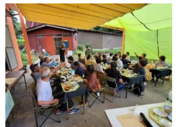
山本地区コミュニティセンター行