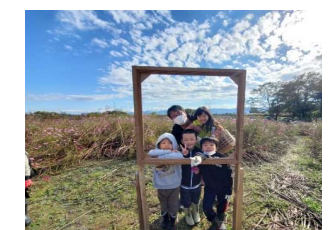
造形大学学生が製作した額縁 (OasisR コスモス畑)