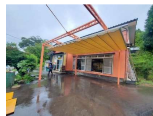
開閉式屋根付きテラス