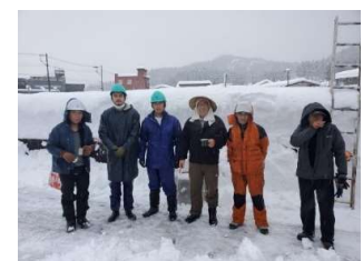
ニコニコ雪下ろし隊

名簿登録のうち、実施しなかった家、2回、3回実施した家とあったが、合計28軒の雪下ろしを行った。