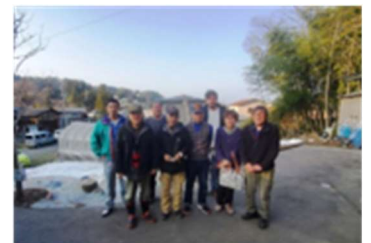
中央後ろの背の高いのがエアラス君