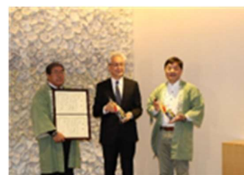
どぶろく樹書報告 市長表敬