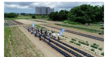
長岡労働金庫の70周年記念イベント