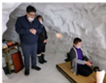
かまくらでのお点前

OasisRでの焚火ピクニック、2月のトリーア市受け入れの際に作った巨大かまくらでのお点前や、冬の晴れ間を狙ってのかんじき、スノーシューでのトレッキング、そして3月の初春の登山スキー等、今後インバウンド等今年度都市部からの訪問者を受け入れるイベント、アクティビティ等開発することが出来た。これまでの農業体験や山菜、キノコ、そしてくろもじ 採取などと併せて具体的かつ安全なイベントプログラムを作成提案していきたい。