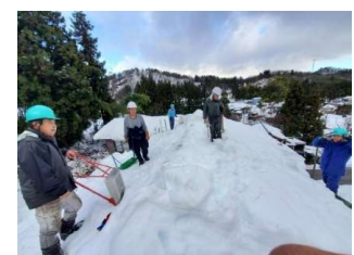
複数人での雪下ろし