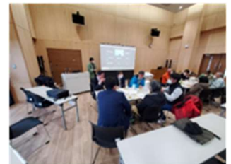
ノウフクフォーラム

農林水産省の交付金事業で2月14日トチオーレにて農福連携フォーラムを開催し50名の方々が集まった。官公庁からの参加もあり、UNEの農福連携の取り組みの他、十日町松代の妻有の大地の芸術祭の事務局から3人参加いただき事例発表をしてもらった。その後、参加者でワークショップを行い中山間地域の今後の活性化の在り方について議論した。