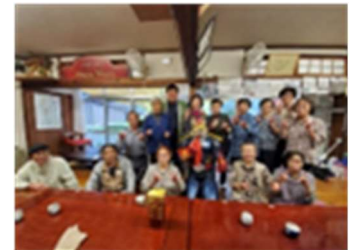
UX21 トチオンガー7と共に

家の光、栃尾タイムス、フジテレビ(めざまし8)、UX21、新潟日報、NCT、経済新聞、日本農業新聞、現代農業などの取材受入れや、記事等を投稿してUNEの活動を取り上げて貰った。主なテーマは「農福連携」「どぶろく」「中山間地活性化」「採取農業」であった。