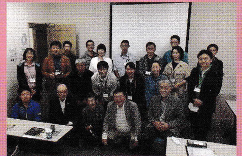
第二期生の顔ぶれ→ 遠くは佐渡からも受講生が参加しました。

令和4年3月には、上越市民プラザにて「農福連携フォーラム2022@高田」を開催。基調講演、実践発表などを通して、これからの農福連携の在り方そして進め方について意見交換しました。