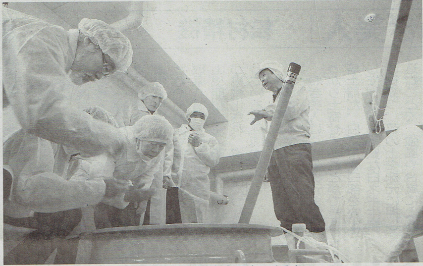
丸山酒造場を見学したE米つくる会

越市で「E米つくる会」を開いた。地元酒造会社4社の製造責任者と酒造好適米生産者24人が参加